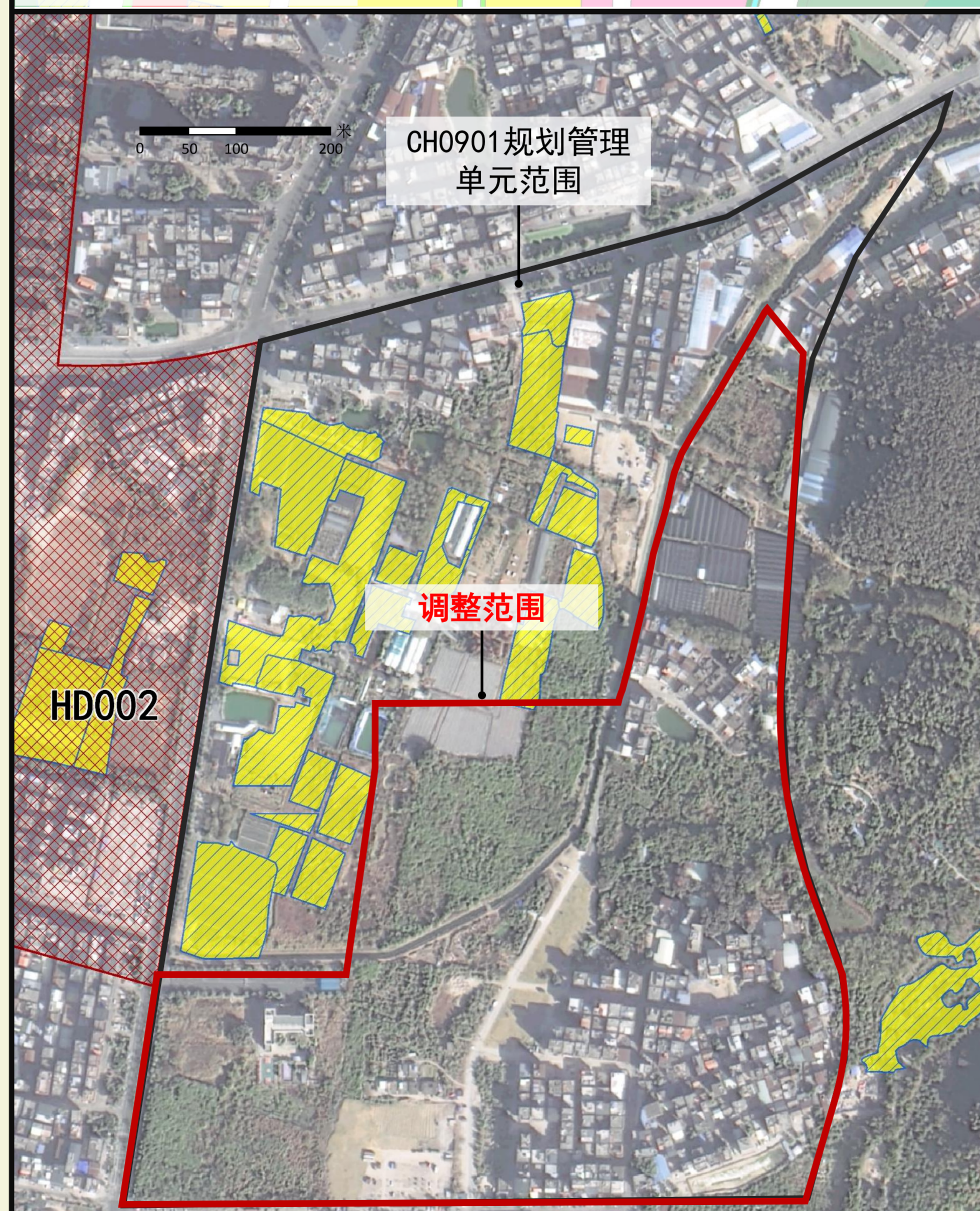
原工业产业区块线示意图