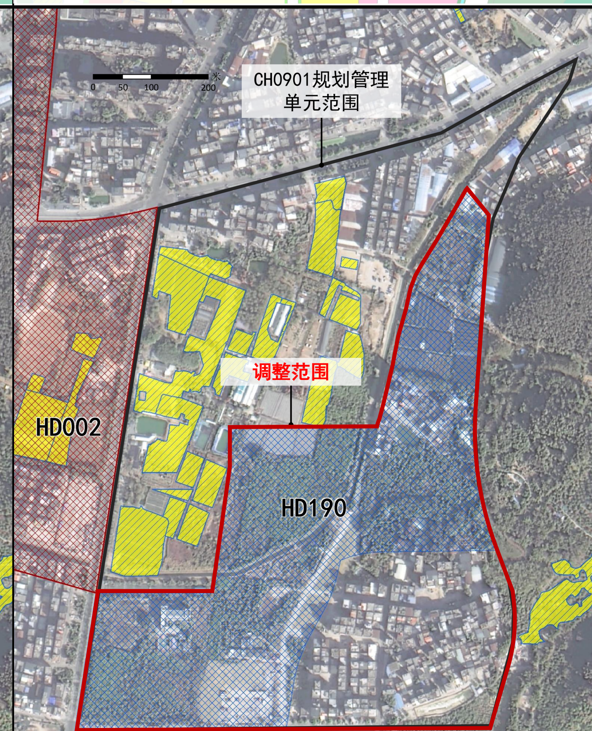
拟优化工业产业区块线示意图